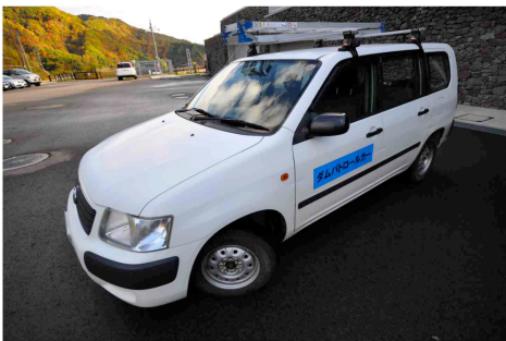
↑ダムパトロールカー

森吉山ダム管理支所を所管している能代河川国道事務所では、降雨や河川の状況を把握し、洪水時に水防警報や洪水予報などの情報を発表しています。これらの情報は、市町村が水防団の出動や、住民への避難勧告を発令する際の基準のひとつとなる「国民の生命・財産を守るための重要な情報」です。