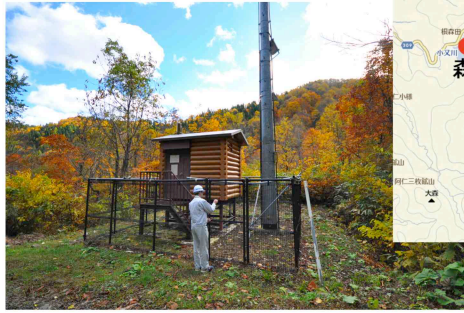
↑右上図③西又沢観測所