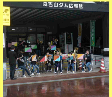
■森吉中学校 吹奏楽部 演奏会