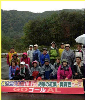
■絶景の奥森吉ウォーキング