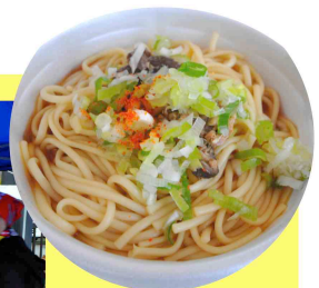
四季美湖を守る会の 「幻の細越うどん」 サバの出汁で絶品！