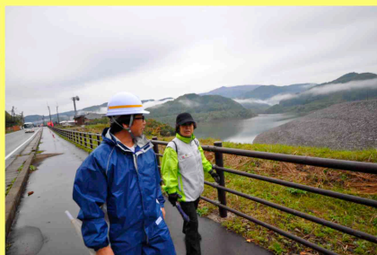
■ダム湖周辺巡視ウォーキング