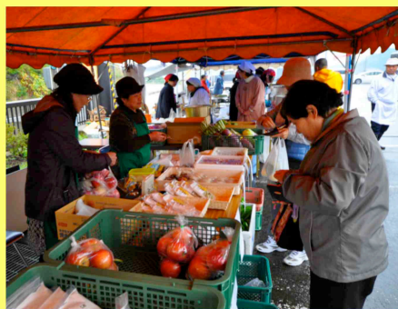
■採れたて野菜やキノコがいっぱい！