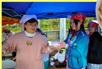
■地元の物販コーナーに高校生ボランティアも参加