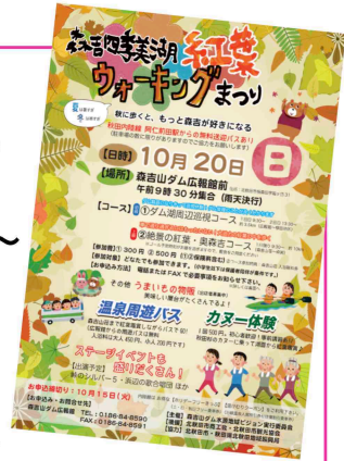
↑ チラシは北秋田市内各施設で配布中です

主催は森吉山ダム水源地域ビジョン実行委員会は、森吉山麓の自然環境を活かして、地域活性化につなげようと地域住民と行政が協力した活動を続けています。当日は最寄りの阿仁前田駅より無料のシャトルバスが運行されますのでご利用下さい。