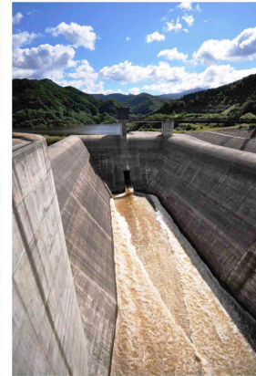
← 台風の翌日(17日10:00) 洪水吐から撮影。

洪水で流れ込んだ水を貯め込んで、最大でも毎秒約70立方メートル放流し、洪水の被害が軽減されるように努めています。