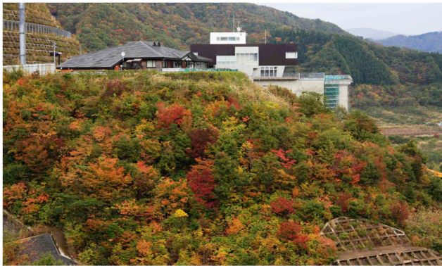
↑ 昨年(2012年10月)の広報館周辺の様子

今年の紅葉まつりはウォーキングがメイン！ 車で通り過ぎるにはもったいない大迫力の紅葉の中を歩きます。