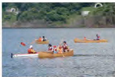
↑ 昨年のカヌー体験の様子