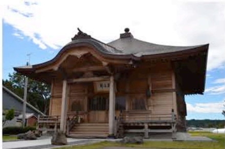
2012年9月 本堂外観。 水源地域の安全と発展をお祈りしました。

外観の写真は昨年9月、大仏様のお顔は12月に撮影したものです。ダム広報館へいらっしゃったお客様が、とても素晴らしいと絶賛されていたので、今回取材に伺ったのですが、実物の大きさに圧倒されてしまいました。このような豪族もいなかった地域にこれほど大きな仏像があること自体が奇跡だと言うことで密かなパワースポットにもなっているようです。