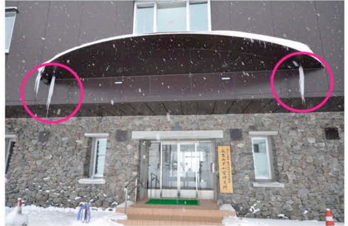
ダム管理支所、仕事始めの日。玄関には門松ならぬ門ツララが。 (危険ですので屋根の下には近付かないでください)