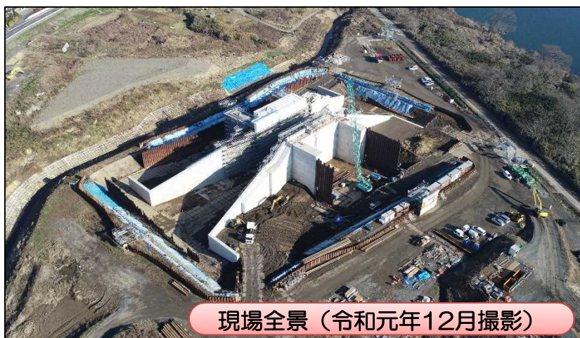
現場全景（令和元年12月撮影）