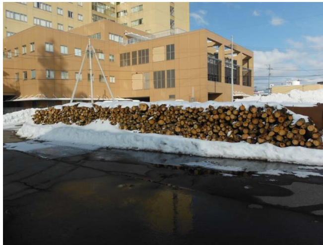
写真 伐採木集積状況

本取り組みでは地域の方々に対し、伐採した樹木を無償で提供することで、処分経費は従来に比べコスト縮減が見込まれます。また、資源の有効活用、より効果的な伐採計画の実施につなげて行くことを目的としております。