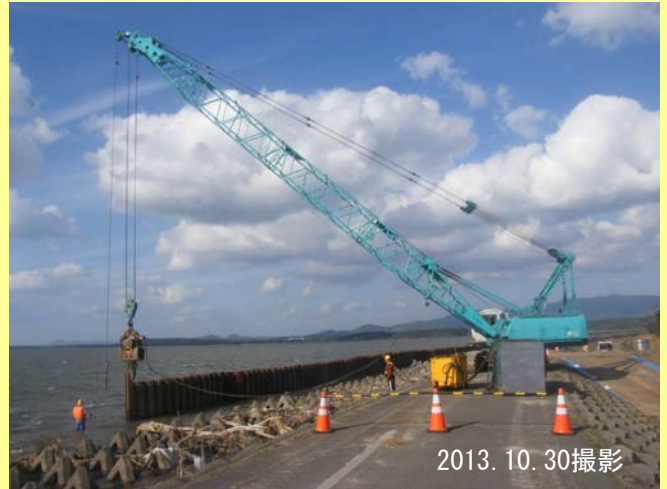
▲仮締切鋼矢板設置作業