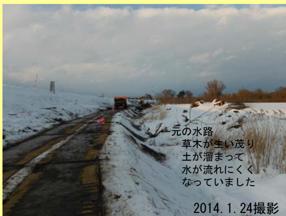
元の水路 草木が生い茂り 土が溜まって 水が流れにくく なっていました