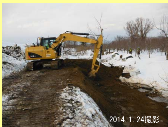
キャリアダンプから土を降ろし、バックホーで敷き均します