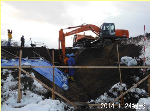
新しく造る水路の形にあわせ掘削します