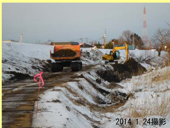
掘削した土は、使用なくなる水路を埋めるために使います