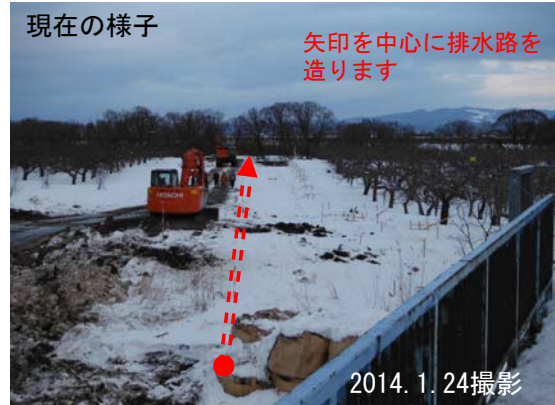
工事に必要な用地を確保し支障となる樹木も伐採され、本格的に工事がはじまりました