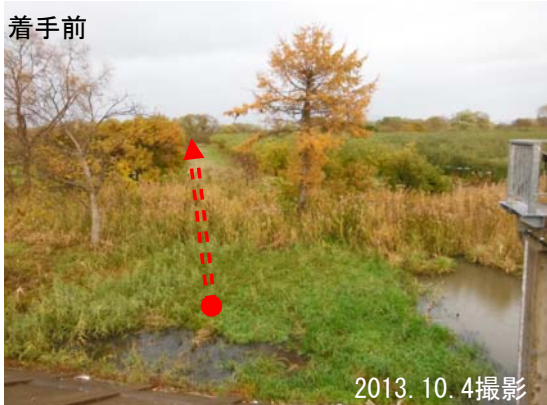
これまで、水路の流れが悪く常に水が溜まった状態になっていました