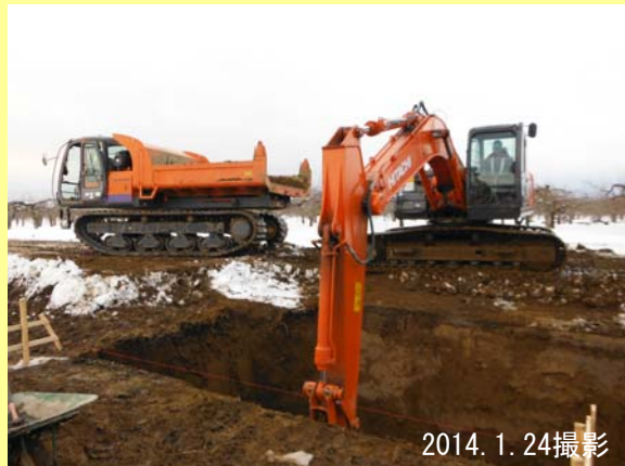
掘削した土はキャリアダンプに積み運びます