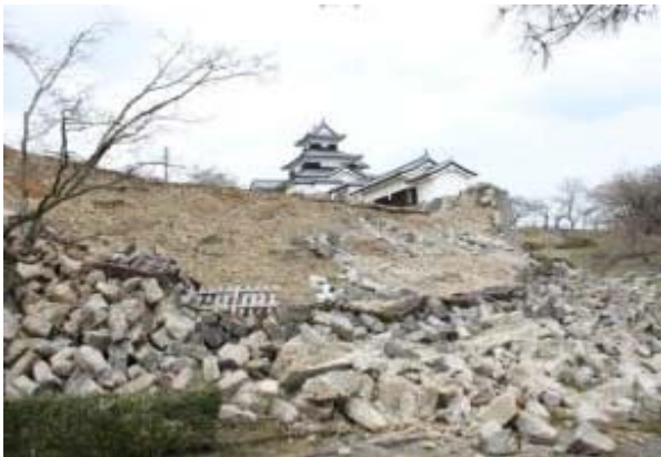
震災により崩落した石垣（本丸南面）

市長) 市長就任当時、小峰城は国の史跡指定を受けていませんでした。都市公園事業でやれば整備はできるし、文化財になれば窮屈だという意見もありましたが、市長になってすぐに文化財指定の準備の指示を出し、平成 22 年の 8 月に史跡指定を受けることができました。それが幸いして文化財予算で震災の復興に取り組むことができます。小峰城は白河を代表する歴史的資源ですから、小峰城はまず守らなければなりません。石垣も孕んで（ふくらんで）いるので、都市公園事業での復旧ではセメントを流し込むような工法になってしまいます。それでは国指定史跡の復旧にはなじまないと考え、ここは文化庁所管の事業として実施することとしました。