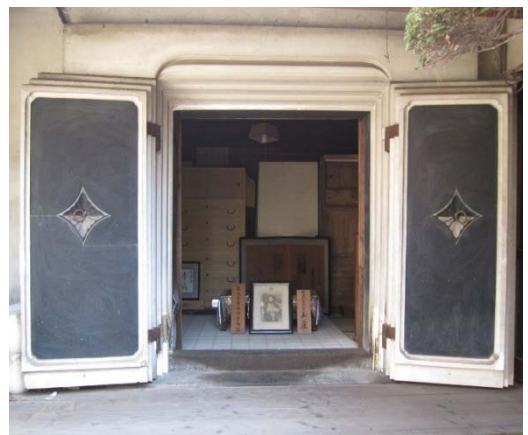
旧脇本陣柳屋旅館の蔵座敷

市長) 現在改修工事中の旧脇本陣は、旧奥州街道の中心にあり、戊辰戦争とゆかりのある歴史的な建造物ですが、これをどうやってまちづくりに生かすか、地元の町内会と懇談の機会を儲け、いろいろ話をしているところです。また、別の町内会とは景観協定についての話し合いをしています。私は、市民との市政懇談会など機会があるごとに、白河の歴史文化というものは足元にいろいろな資源があるのではないか、それを活かさないということは考えられないということを 10 年間言い続けてきました。市民の方々にもある程度浸透していると思っています。まちづくり会社