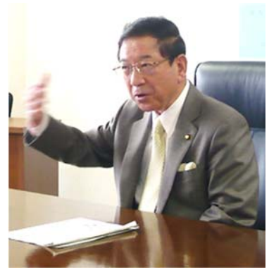
鈴木和夫白河市長

市長) 東北歴史まちづくりサミットのときにも披露した話ですが、私は白河市出身で、市長に就任する以前は、福島県の職員として県の行政に取り組んでいました。そこで、様々な市町村のまちづくりを支援していたわけですが、その当時、県内には 90 市町村あり、特に平成のバブルがはじけて以降の、各市町村の様々な取り組みの中で、自分の個性を生かしたまちづくりを進めていこうという機運が高まっていた時期でした。例えば会津若松市、白河市、相馬市などは歴史的な文化財が沢山あり、それを活かしたまちづくりというのが、これからの地域づくりには必要だと強く感じたわけです。抽象的に言えば、外部の力を借りてくる、国の補助金、交付税で財政支援をお願いするというのが