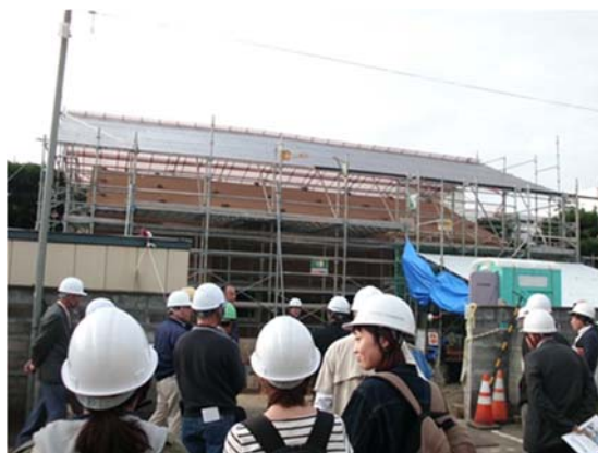
NPO しらかわ建築サポートセンターによる 伝統的技術伝承事業研修会（現場見学）

市長) そうだと思います。まちづくりをする団体はたくさんあります。建築士というのは具体的な建築を通して街の景観をつくるわけですから、まちづくりに大きな影響を持っています。 公共性を持っているので、建築士の方々をまちづくりに組み入れていくことは有効だと思います。