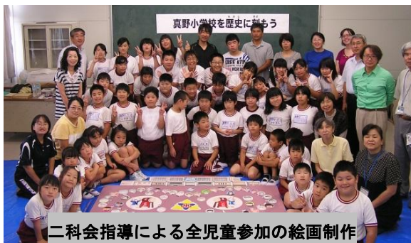
真野小学校を歴史に刻もう