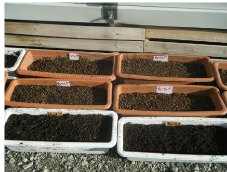
支援物資として送られた球根もみんなの春のお楽しみ

③ 写真ギャラリー・④ 交流拠点：震災直後からこの地域に通いボランティアに関わった人達の活動を常時展示し被災地と外部との交流の機会を創出する手段としてギャラリーを提案したが、サポートセンターがその役割を担うこととなった。仮設住宅の関係者と協議し宿泊のルールも決め、現在も地域とボランティアの交流の場となっている。