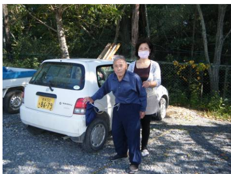
買い物送迎の様子

① 買物代行：相川運動公園仮設住宅から推薦により2名の仮設住宅サポーターを雇用し事業にあたった。利用者のニーズ発掘も兼ね、受け皿を広くするため診療所や美容室などへの送迎もサービスに含め告知を行った。活動当初は週3回（月水金）の限定サービスとしたが利用者のニーズにバラツキがあったためオーダーにあわせて随時サービスの提供を行うよう運用方法を改善した。特に車を持たない高齢者の送迎が中心となった。