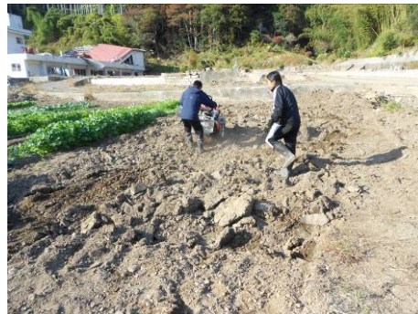
農園の拡幅に精を出す