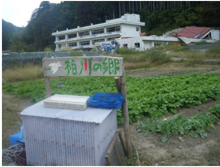
瓦礫撤去から農園として再生

④ 市民農園：瓦礫を拾った跡地を耕運し農地として復興することで生産→交流→収穫→交流という大地と人の関わりを創出した。