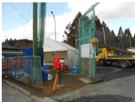
東京からの働きかけにより 震災から10ヶ月目にして ようやく設置された郵便ポスト

③ 支所での書類取得代行：行政の方から仮設住宅に出向いてニーズを拾い上げるなど、地縁的なつながりが多く官民同士、顔の見える理想的な関係と行政の速やかな対応が印象に残った。書類の取得などについては、役場や支所へ直接利用者を送迎し対応した。