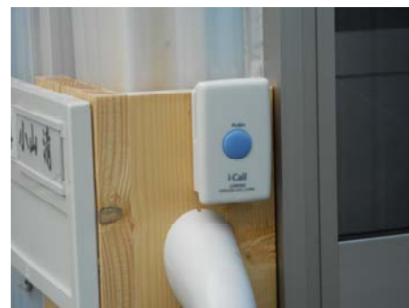
防寒のために取付けられた 二重サッシが裏目に・・・ 社会福祉協議会に要請し設置 された玄関チャイム