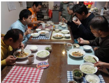
福祉施設から来たボランティアに送られた野菜達