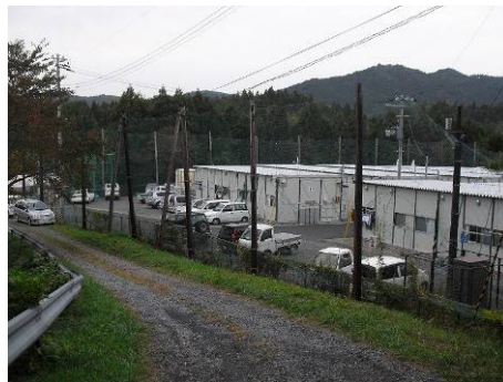
相川運動公園仮設住宅の様子