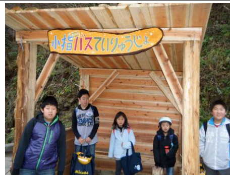
小指スクールバス停留所から通う子どもたち