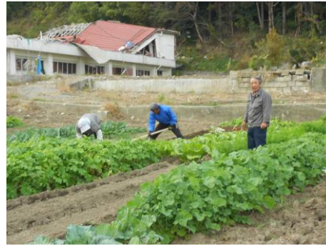
コミュニティの創生