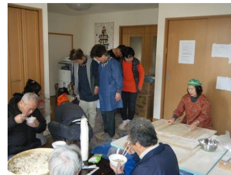
そば振る舞いに駆けつけたボランティアをコーディネート