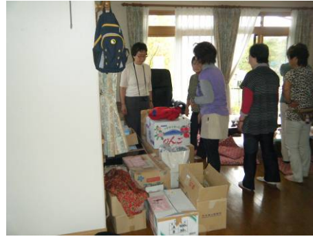
物資が溜まるとこのように配布作業を行います