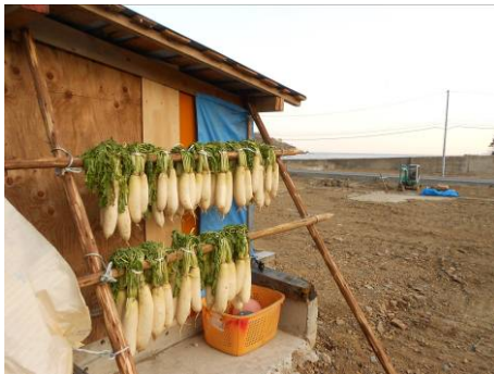
風に揺れる見事な大根