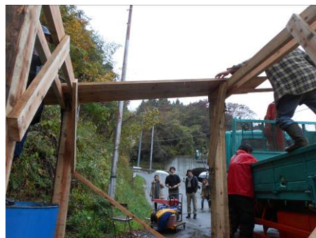
地域の要望により建てられたスクールバスの停留所