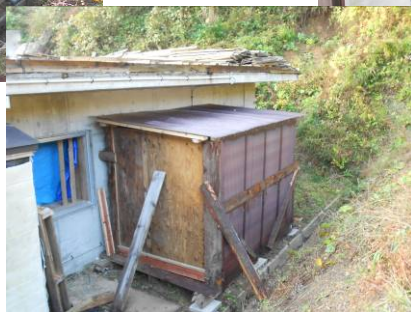
被災木が 倉庫として甦る