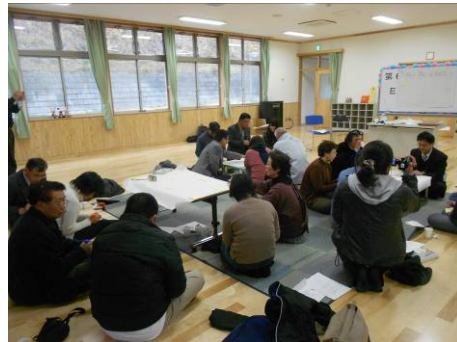
地域と小学校について宮城教育大学と開催した地域づくりセミナー