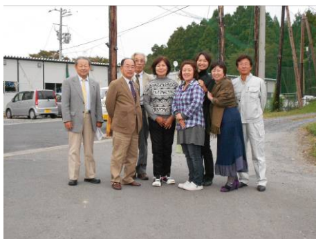
福岡県から来た議員団の視察の様子 被災地の被害状況を視察にたくさんの方々が来所