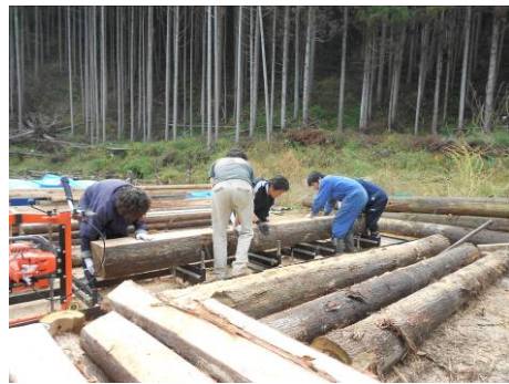
被災木を製材するボランティア