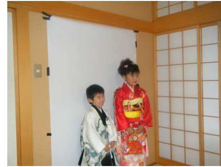
衣装から全て用意され開催された七五三の写真撮影会