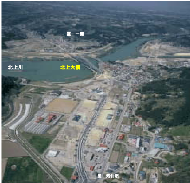
平成15年度の供用に向けて工が進む北上大橋