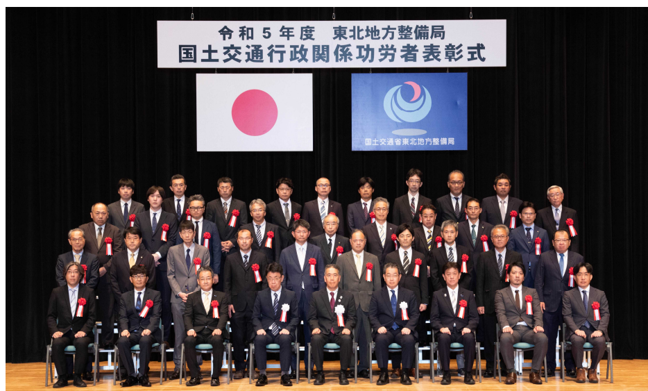
【東北地方整備局長表彰（優良業務施行者）集合写真】