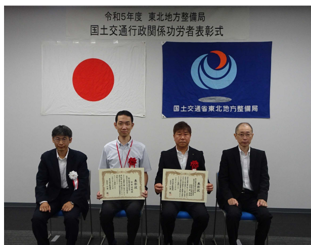
【受賞者との記念撮影】