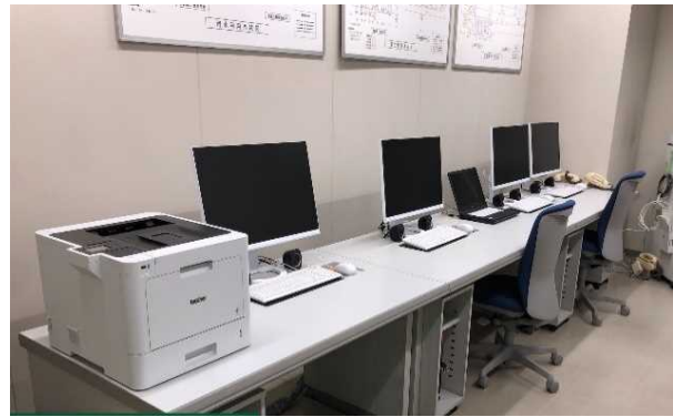
【中央監視装置の更新】