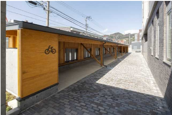
[ 自転車置場 ]

また、1階エントランスホールはあたたかみのある雰囲気をつくるため杉（福島県産）等木材を使用しています。