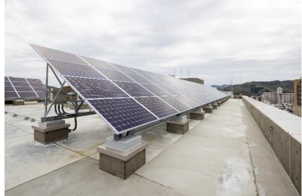
[ 太陽光発電設備 ]