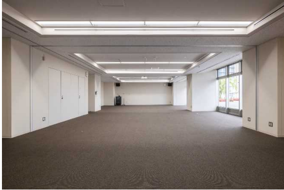
[ 一時的な避難スペース（1階会議室） ]

また、非常用発電機が万が一停止した場合でも、太陽光発電の蓄電池により、1階エントランスホールの照明やコンセントに電力供給が可能としています。