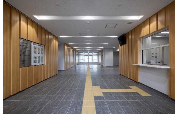
[ 1階エントランスホール ]