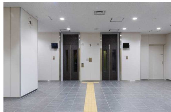
[ 1階エレベーターホール ]

検討会においては、エレベーターの中の様子が分かるようにしてほしいと意見があり、1階ホールにエレベーター内部の様子が分かるモニターの設置、エレベーター扉に防犯窓を設置するなど施設整備に反映しました。