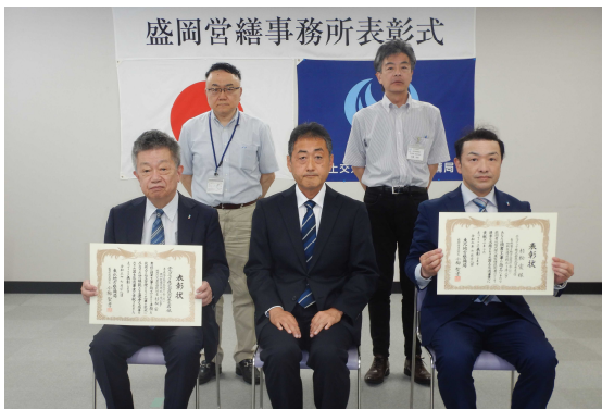
【受賞者との記念撮影】

更に、工事書類の効率化や情報共有の迅速化を図るため情報共有システムを導入するなど、ICTを積極的に活用し工事関係者との調整を円滑化、生産性向上に取り組み工期限内に工事を完成しました。