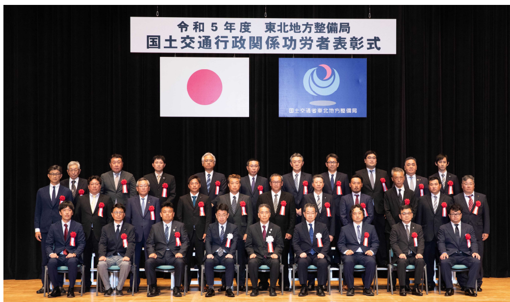
【東北地方整備局長表彰（優良工事施工者）集合写真】