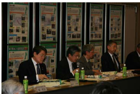
【協議会委員からのアドバイス】

パートナーシップから平成23年度に新たに開始した取り組みや内容が充実してきている取り組みについての問題や課題を発表していただき、それに対して協議会委員より、今後活動する上でのアドバイスをしていただきました。