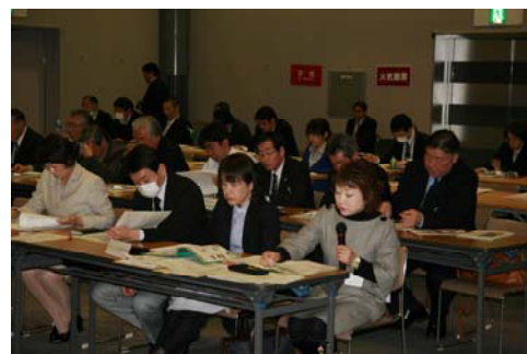
【各団体からの活動計画の報告】