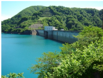
▲青い湖水が特徴的な宝仙湖

※ダム堤体、放流設備、監査廊はダム担当職員の案内により見学します。ダム資料館（当日）や玉川ダムHPの様式を使用してFAX等でお申し込み下さい。（当日可。1名から可。見学時間9：00～11：00、13：00～15：00 駐車可35台程度）