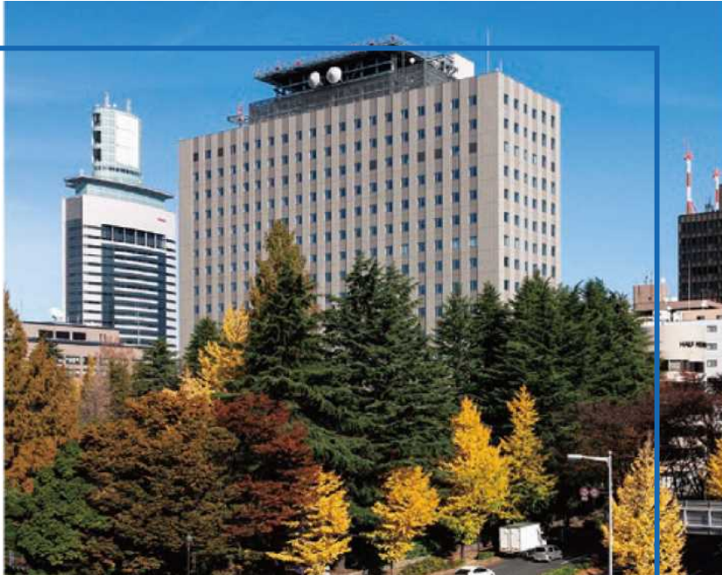
▲東北地方整備局(仙台合同庁舎B棟)