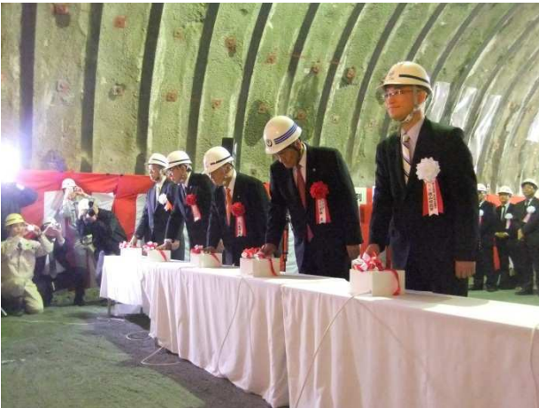
最後の掘削開始スイッチを押す関係者 (貫通の儀)