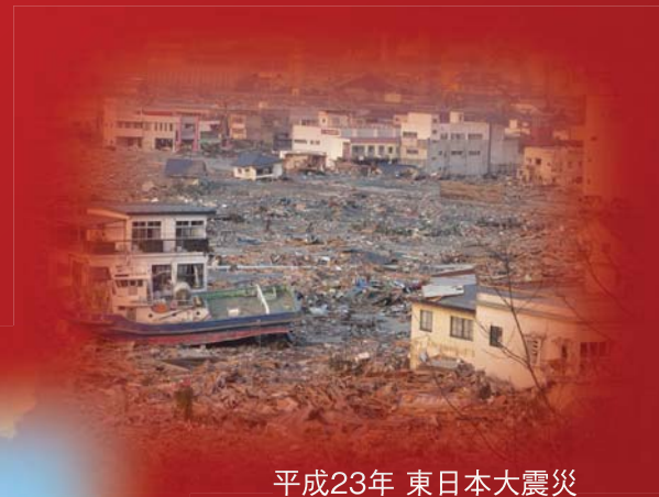
平成23年 東日本大震災