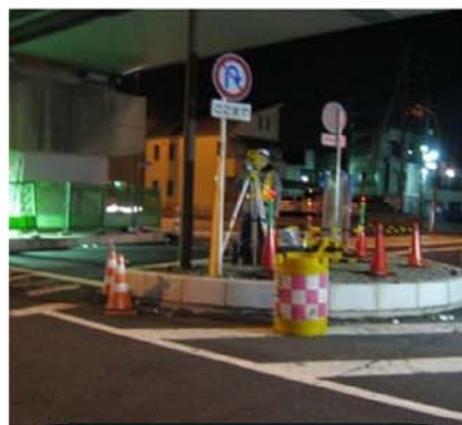
車道規制外からの計測状況

歩道等からの工事測量や作業帯外からの出来形計測が可能となり、交通事故や重機災害の未然防止につながる。