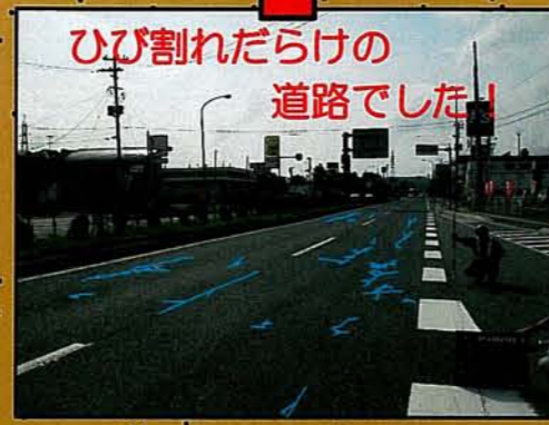
ひび割れだらけの道路でした！