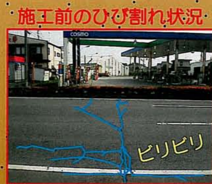
施工前のひび割れ状況