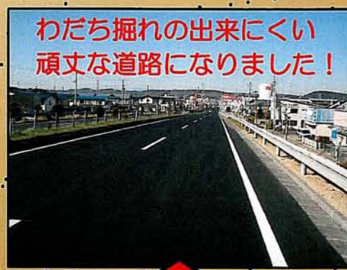
わだち掘れの出来にくい頑丈な道路になりました！