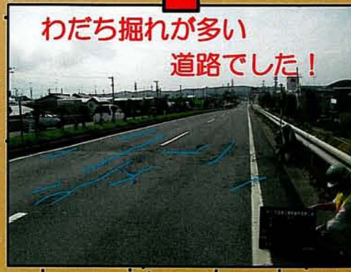
わだち掘れが多い道路でした！