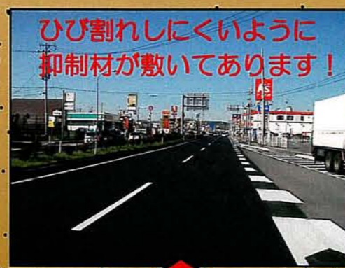
ひび割れしにくいように抑制材が敷いてあります！