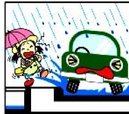
スリップ 水はねがある