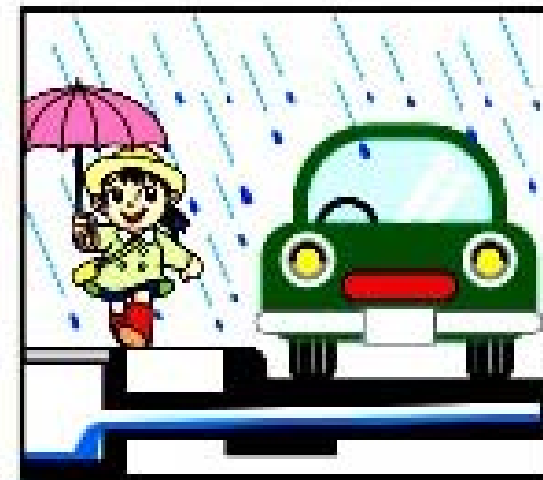
快適 水はねが少なくなります