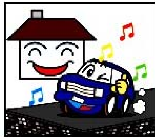
騒音が少し 少なくなります