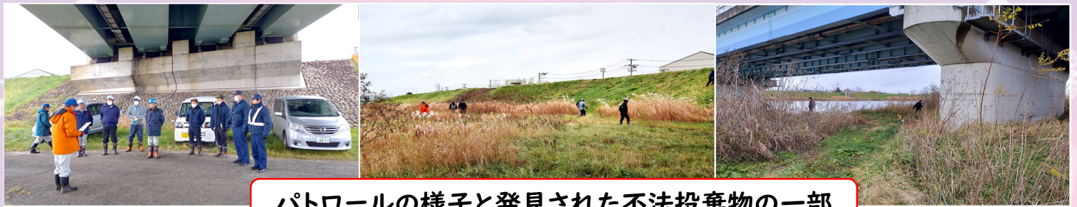
パトロールの様子と発見された不法投棄物の一部