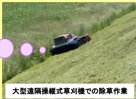
大型遠隔操縦式草刈機での除草作業