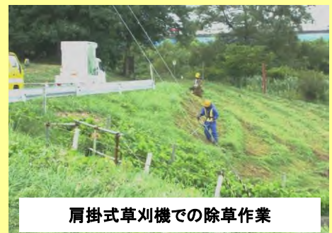
肩掛式草刈機での除草作業