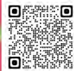
青森河川国道 事務所Twitter