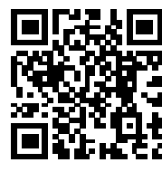
国土交通省ハザードマップ ポータルサイト