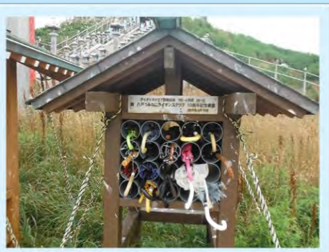
ウミネコ爆弾避けの傘があります

お参りする前に神社の周りを3周してください。「運開きめぐり」といって、心身が疲い清められ運が開けると云われています。