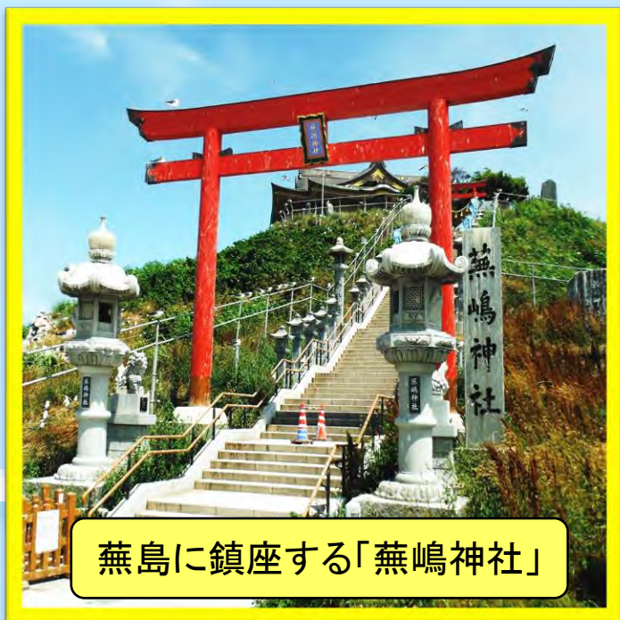
燕島に鎮座する「燕嶋神社」

燕島は、元々独立した島でしたが、1942年(昭和17年)旧海軍により埋立てられ陸続きとなりました。その後、ウミネコの繁殖地として1922年(大正11年)天然記念物に、更に2013年(平成25年)には三陸復興国立公園に指定されました。毎年3月頃から4月頃にかけてウミネコが燕島に飛来してきます。5月頃卵を産み、6月に孵化、7月にはヒナが巣立ち8月になると島を離れていきます。繁殖期にはおよそ4万羽ものウミネコがいるため、『ウミネコ爆弾』と呼ばれる『運』をもらう場合もありますので注意が必要です。もし、ウミネコ爆弾に当たってしまったら、拭き取る前に社務所まで行ってください。会運証明を発行してもらえます。