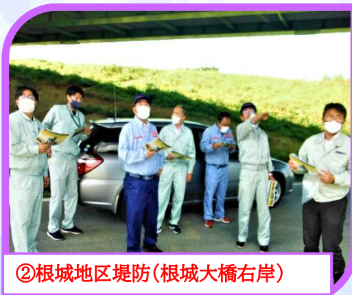
②根城地区堤防(根城大橋右岸)