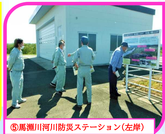
⑤馬淵川河川防災ステーション(左岸)