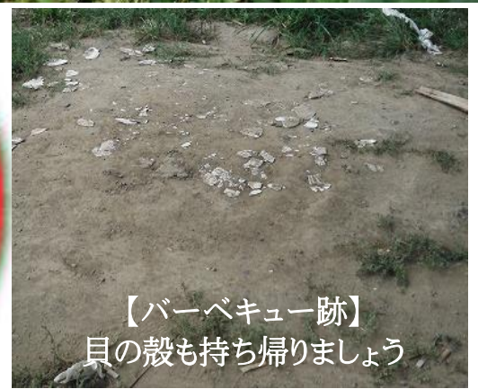
【バーベキュー跡】 貝の殻も持ち帰りましょう