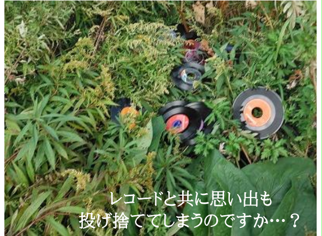
レコードと共に思い出も 投げ捨ててしまうのですか…？