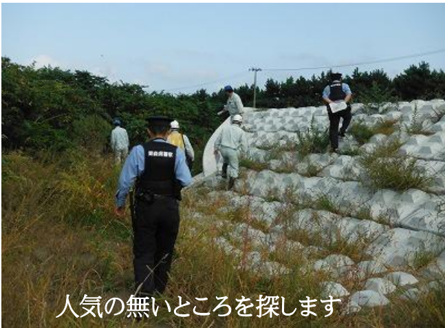
人気の無いところを探します

平成22年から行われている3機関（青森河川国道事務所、八戸警察署、八戸市清掃事務所）が合同で馬淵川河川敷への不法投棄防止を目的とした多発箇所のパトロールを行いました。