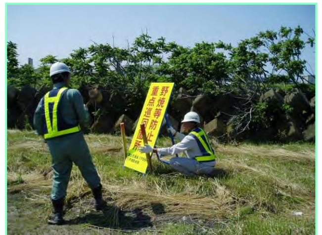
特に野焼きが多い箇所には立て看板を設置しまし