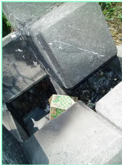
防波ブロックを竈代わりに……