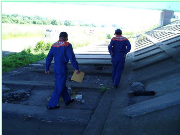
花火の不始末発見！！

バーベキューや花火は夏の楽しみのひとつですが、火の不始末は火災に繋がります。 馬淵川河川敷での火災を防ぐため、青森河川国道事務所と八戸広域消防本部が合同パトロールを行いました。