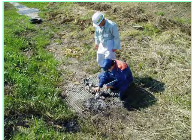
ゴミ焼きの跡発見。禁止行為です