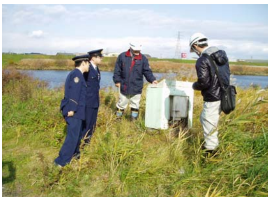
パトロール中、水辺の築校内で洗濯機を発見いたしました。