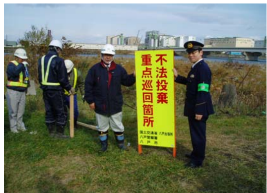
このような「不法投棄重点巡回箇所」の立看板を設置して、不法投棄を防止するよう促します。