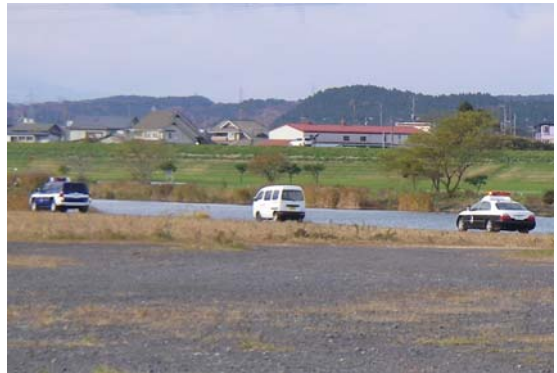
八戸出張所のパトロールカーを先頭に、河川敷をパトロールしました。