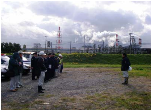
合同パトロール前に出動式を行いました。

11月15日(月)、寒風吹きすさぶ中、青森河川国道事務所、八戸警察署、八戸清掃事務所との3機関合同で、不法投棄の撲滅を目指すべく「馬淵川河口～根城大橋」までの区間の合同パトロールを実施とともに、特に不法投棄が多い箇所(箇所)に立看板を設置しました。 (上半期に八戸出張所でゴミ処理した回数は70回程でした。)