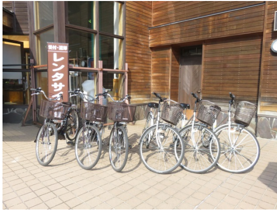
▼ 奥入瀬渓流館のレンタサイクル