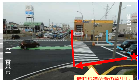
横断歩道位置の前出し