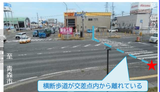
横断歩道が交差点内から離れている