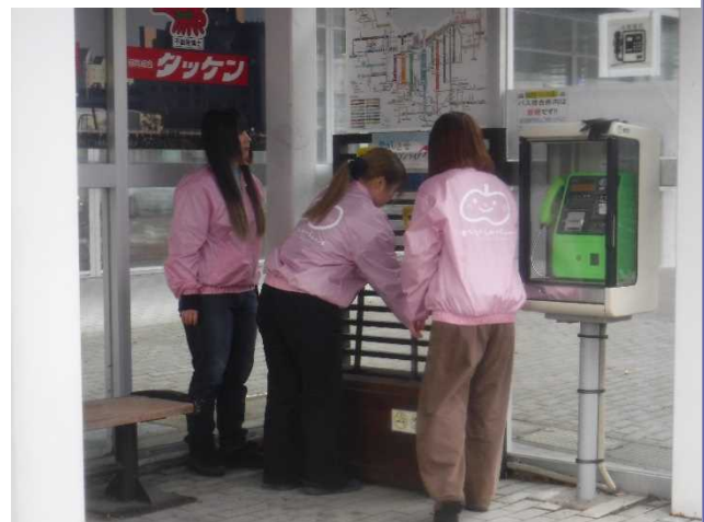
スコップ設置の様子

二十四節気の一つである「大雪の日」の12月7日に、青森公立大学の学生を中心に構成される「まちなかしかへらあ〜s」が主体となって市役所前バス停にてスコップの設置式を行いました。