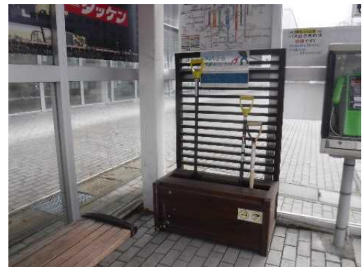
スコップ設置後の写真 (市役所前(山手))

バスを待つ短い時間で雪かきをして頂き、 乗降箇所の安全確保 に協力お願いいたします。