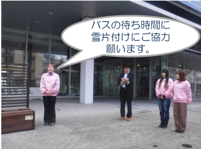
バス停スコップ設置式の様子