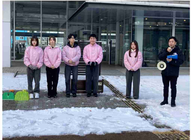
バス停スコップ設置式の様子

平成17年から毎年、二十四節気の一つである「大雪」の日に、バス利用者が待ち時間に雪かきを行い、乗降時の安全を確保することを目的に、スコップを設置しており、青森河川国道事務所はバス停スコップを提供しております。