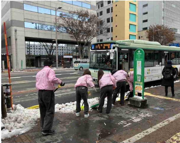
バスの乗降箇所で雪かきの様子