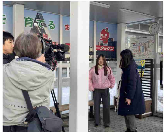
報道各社から取材を受ける まちなかしかへらあ～s 能登代表

バスの待つ短い時間で雪かきをして頂き、乗降箇所の安全確保に協力お願いいたします。