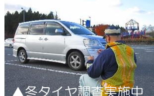
▲冬タイヤ調査実施中