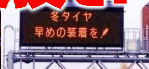
▲11/12早朝「八甲田大橋」気温計“0℃”

青森河川国道事務所では、「早めの冬タイヤ装着運動」の一環として、県内2箇所の道の駅（なみおか・とわだ）で冬タイヤ装着率調査を実施しております。11月12日に今年2回目の調査を行い、装着率が2駅平均で76.5%となり、前年同時期よりは装着率が高いものの、まだ約25%は未装着となっております。