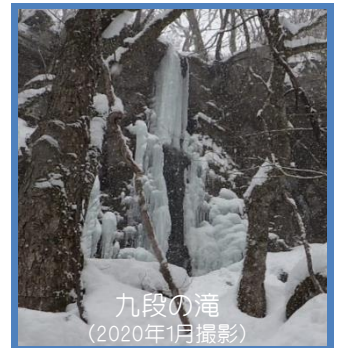
九段の滝 (2020年1月撮影)

これからまだ数年、トンネル工事は続きます。引き続き安全第一で進めてまいりますので、ご理解、ご協力よろしくお願いたします。