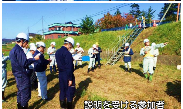
説明を受ける参加者