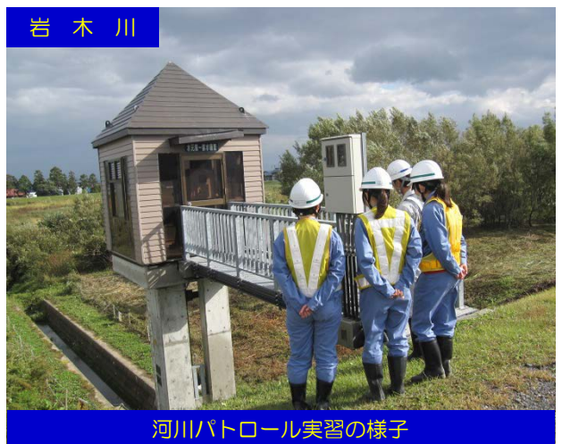
岩木川 河川パトロール実習の様子

参加された生徒の皆さんが今回のインターンシップを通して、実際に河川・道路・ダムの各現場を身近に体験することにより、国土交通行政への理解を更に深めていただければと思っております。