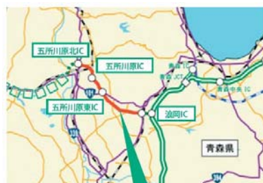
津軽自動車道 五所川原北IC～浪岡