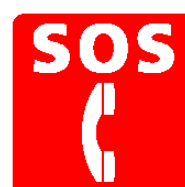
非常電話 Emergency telephone