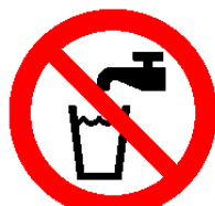
飲めない Not drinking water

http://www.mlit.go.jp/sogoseisaku/zukigou/zukigou02.html