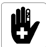
救護所 First aid