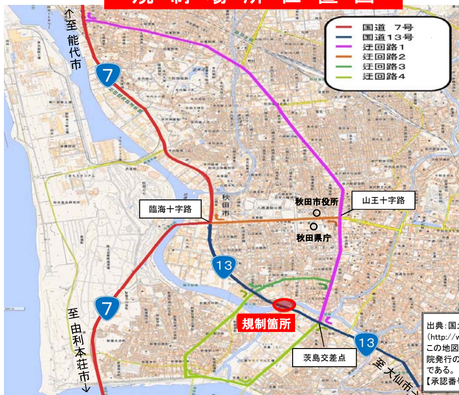
【規制中の走行ルート図】