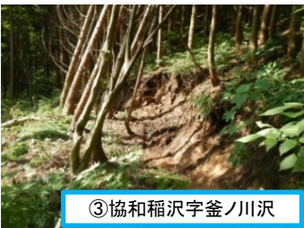
③協和稲沢字釜ノ川沢