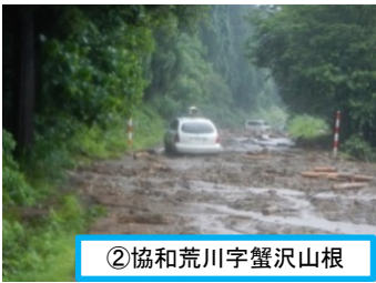
②協和荒川字蟹沢山根