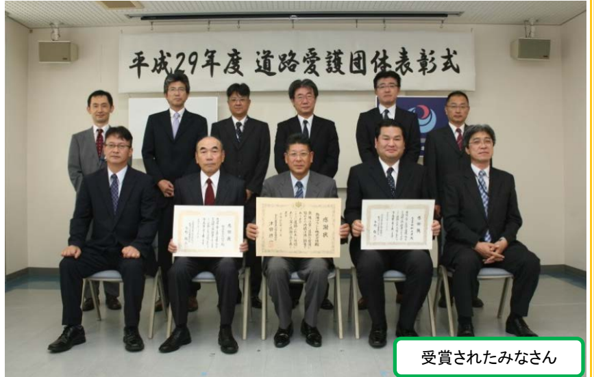
受賞されたみなさん