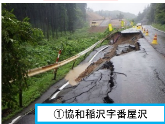
①協和稲沢字番屋沢