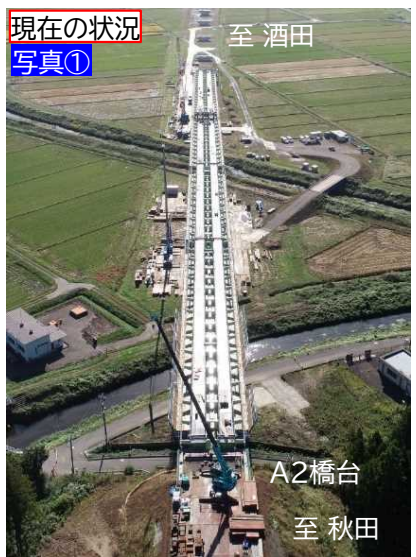
▲(仮)吹浦高架橋 工事状況