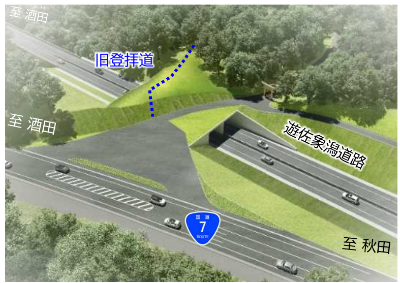
▲旧登拝道を保全する計画に変更