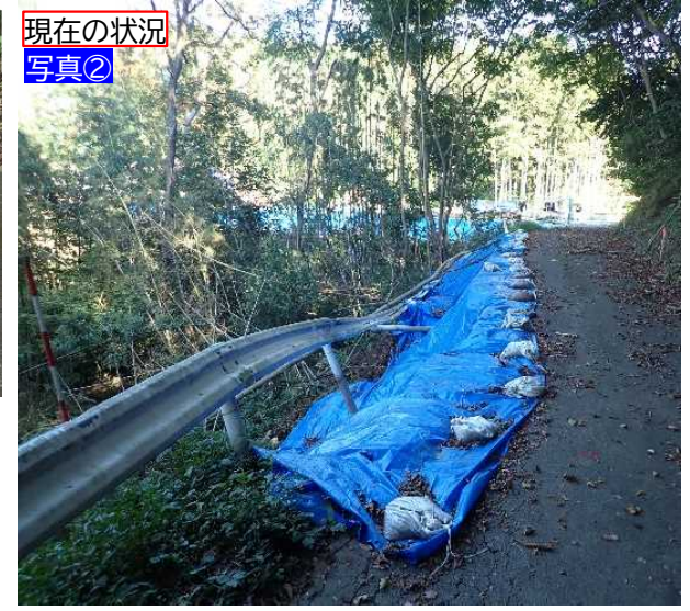
▲工事進入路の状況