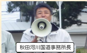
秋田河川国道事務所長