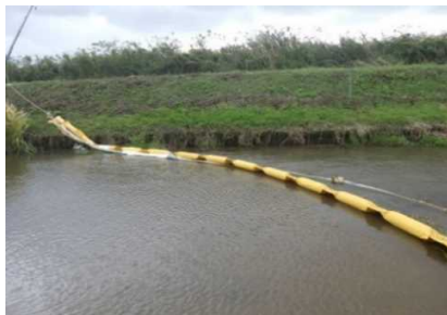
実際にオイルフェンス・オイルマットを設置した様子