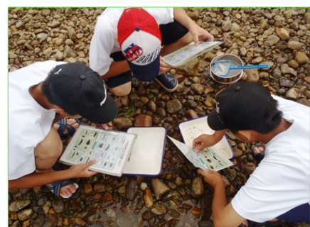
見つけた生物を資料で調べています

これからの台風期は降雨により、急激に川の水位が上がる場合があります。秋の行楽などで河川をご利用の際は、水位情報に十分注意しましょう。