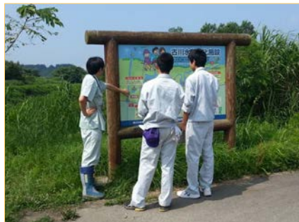
古川浄化施設の説明