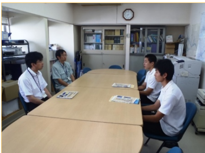
はじめに雄物川の事業概要の説明

7月30日、金足農業高校の生徒2名が、茨島出張所に来所し、河川管理の仕事を体験しました。普段、出張所で行っている河川管理業務のうち、河川パトロールや簡易水質テストを実際に行ってもらい、また河川工事現場の見学をしました。生徒からは「普段学校では体験できないことを体験することができた」、「この体験を今後生かしていきたい」などの感想をいただきました。