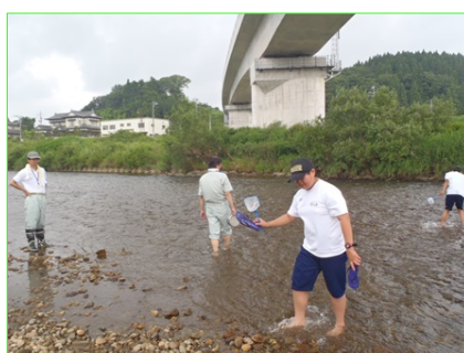
どんな生物がいるかな？