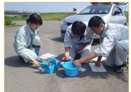
簡易水質テストを実施