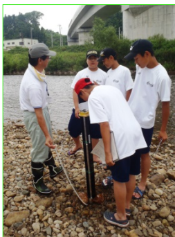
透視度計を使って調査

8月1日、豊岩中学校の生徒が、雄物川の支川である岩見川において水生生物調査を行いました。この日、生徒が採取した水生生物は「ヒラタカゲロウ」や「ヒゲナガカワトビケラ」などきれいな水にすむ生物で、併せて実施したCOD、pHの簡易水質検査、透視度計による調査も含め、この川はきれいな川という調査結果となりました。みんなでこのきれいな川を守っていくことを誓い終了しました。