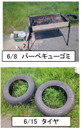
6/8 バーベキューゴミ