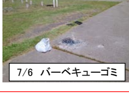
7/6 バーベキューゴミ