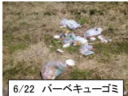
6/22 バーベキューゴミ