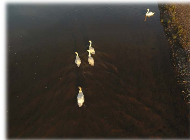
雄物川に住み着いている白鳥一家