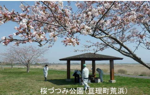
桜づつみ公園(亶理町荒浜)