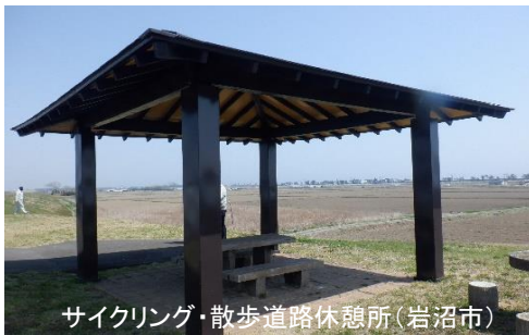
サイクリング・散歩道路休憩所(岩沼市)