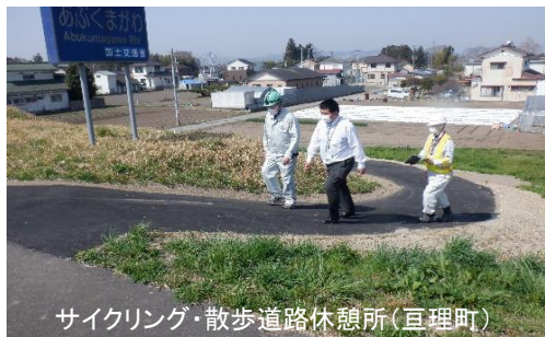
サイクリング・散歩道路休憩所(亶理町)

4月12日(火) 河川施設を安全に利用して頂くため、施設を管理する岩沼市、亶理町、柴田町の担当者と安全点検を行いました。亶理町では、前回の安全点検結果を踏まえ、堤防の入口の舗装や東屋の塗装工事が完了。綺麗に使いやすく改善されていました。岩沼市でも前回使用禁止になっていた東屋の修繕工事が完了。柴田町でも今年度、ベンチの修繕と運動場の段差を無くすための工事を行う予定とのことでした。現状では、阿武隈川運動場柴田グラウンドのベンチを使う時に気を付けて使って頂ければと思います。