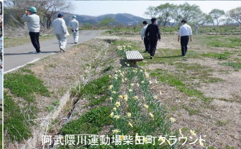
阿武隈川運動場柴田町グラウンド