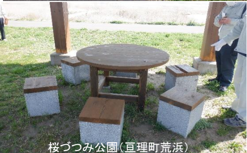
桜づつみ公園(亶理町荒浜)