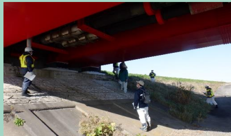
■工作物の周りにコンクリートの浮きなど無いか確認