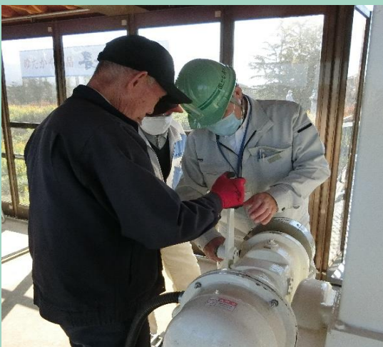
■手動方法指導中の様子

この日は、もしも停電や電気系統の故障でゲートが動かなくなった場合には？ということで、手動でゲートを動かす方法の現地指導も行いました。今回の点検で重大な異常は見つかりませんでしたが、日頃から施設の点検を実施し、洪水時に問題無く操作出来るように努めていきます。