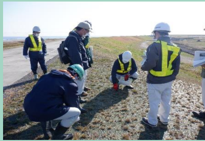
■芝の生育状況を確認